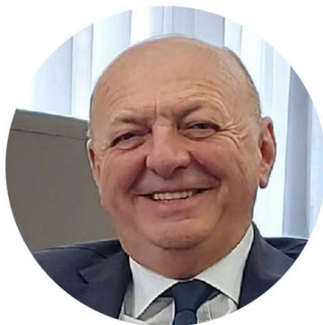
Gilberto Pichetto Fratin

Ministro dell'Ambiente e della Sicurezza Energetica